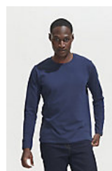
SOL'S Imperial LSL MEN