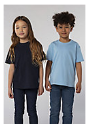
SOL'S Imperial KIDS 11770