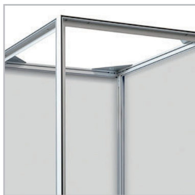
Structure cadre Alu Robuste

Dès 1 exemplaire, commandez votre totem textile 4 faces .