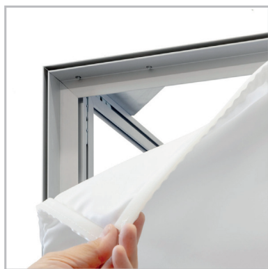
Finition par jonc PVC