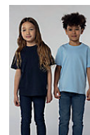
SOL'S Imperial KIDS 11770