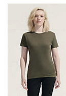
SOL'S REGENT WOMEN 01825