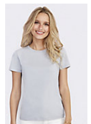
SOL'S REGENT WOMEN 01825