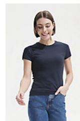
SOL'S MISS 11386