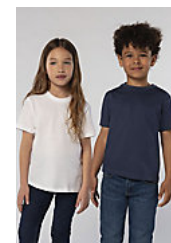
SOL'S REGENT KIDS 11970